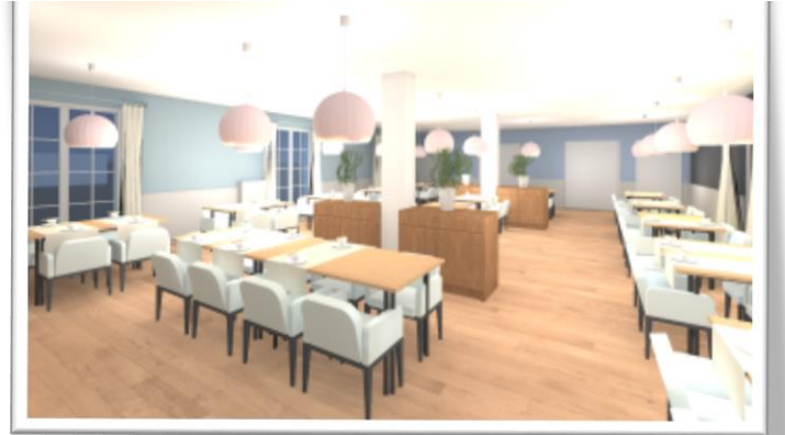
Salle de restauration