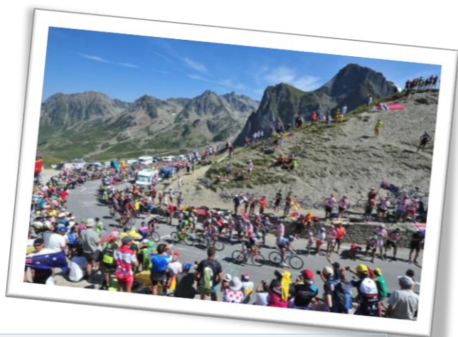
11/072015 - Les coureurs dans le Tourmalet

Nous retrouvons autant de spectateurs enthousiastes sur les bords des routes que les années précédentes. Ce qui assure sa réputation de fête populaire, même si les Pyrénées et ses ascensions mythiques, n'ont pas été assez représentées. A notre grand regret !