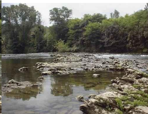
Le Salat à Roquefort