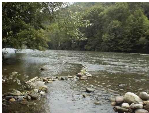
Le Salat à Mercenac