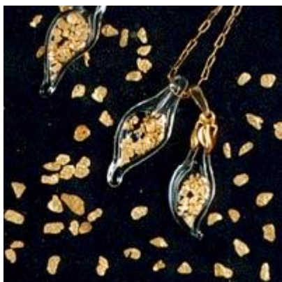
Pendentif avec des paillettes

Une utilisation des paillettes présentée en bijoux que l'on peut s'offrir.