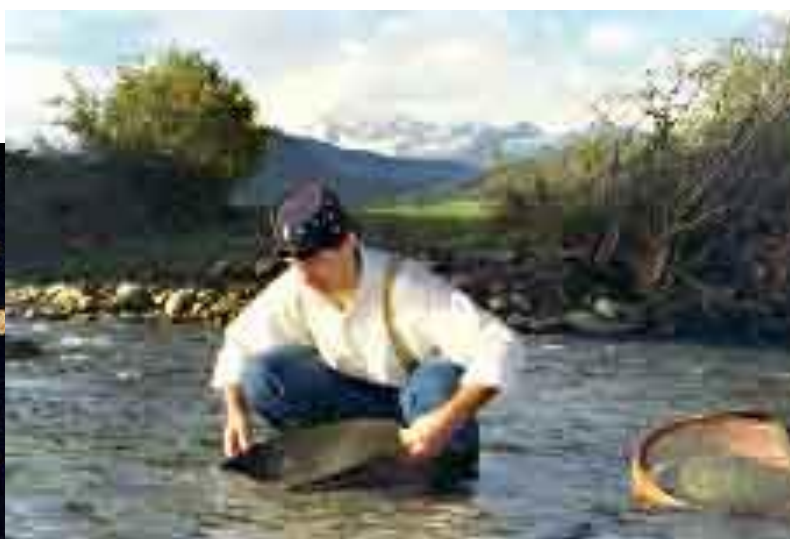
Le travail de l'orpailleur