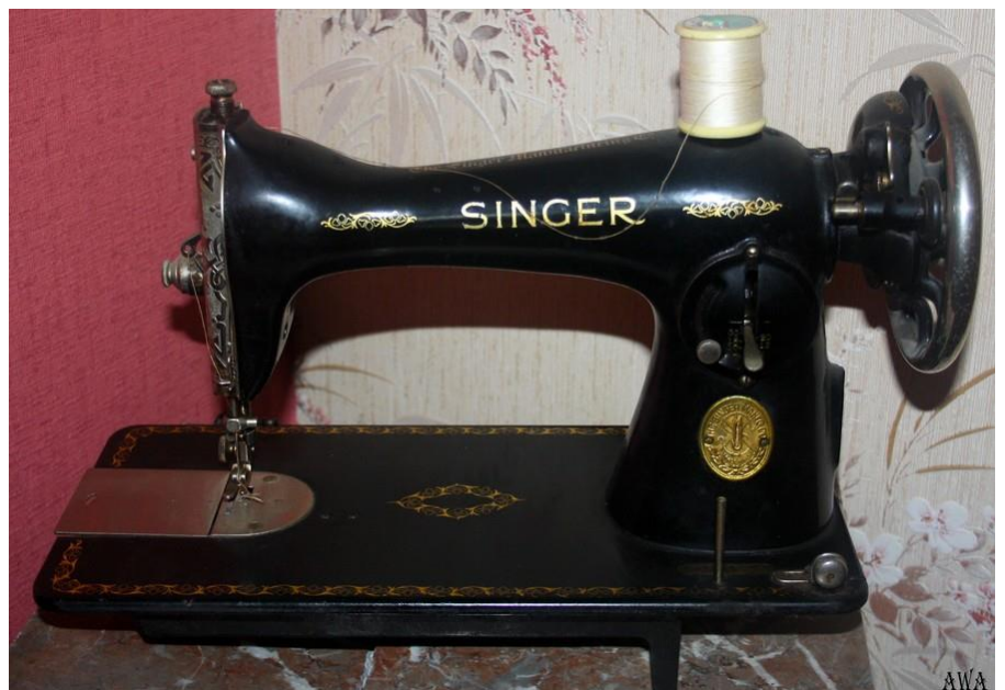
Machine à coudre