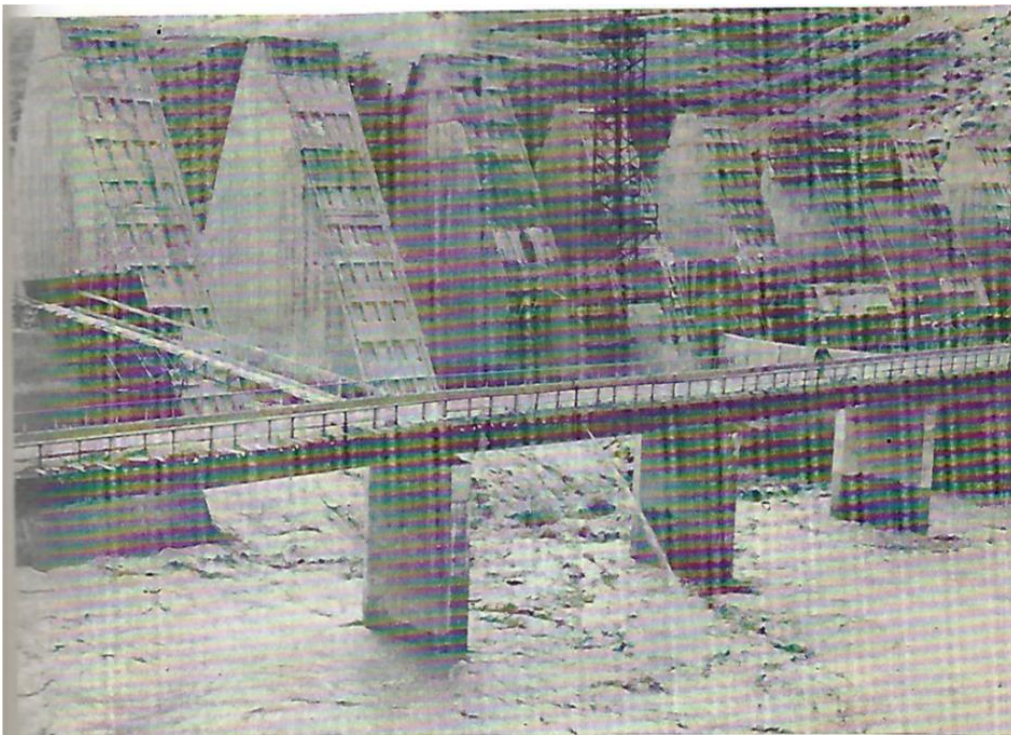
- ARABAT – Barrage Idriss I.

Le barrage d'Arabat est le premier ouvrage d'un ensemble d'aménagements qui, en se valorisant par l'irrigation et la production d'énergie électrique, le bassin de l'oued Sebou, apportera au Royaume du Maroc un potentiel économique qui lui fera faire un nouveau pas très important sur le chemin du progrès et de la prospérité.