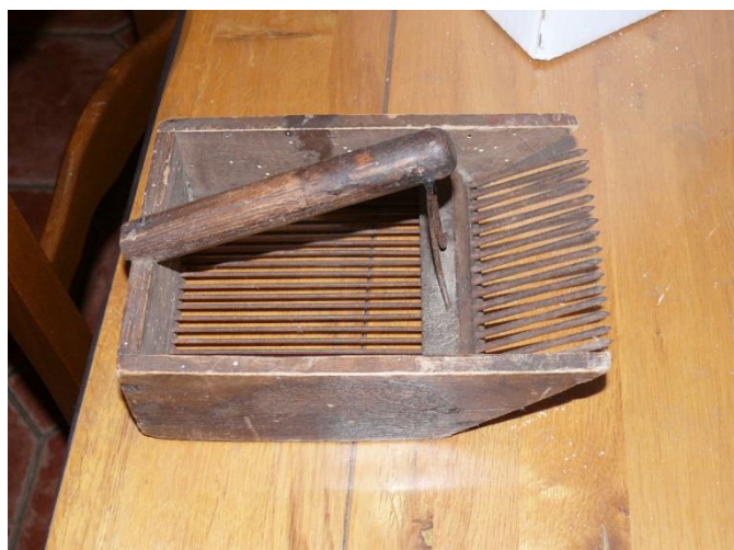
Peigne à myrtilles