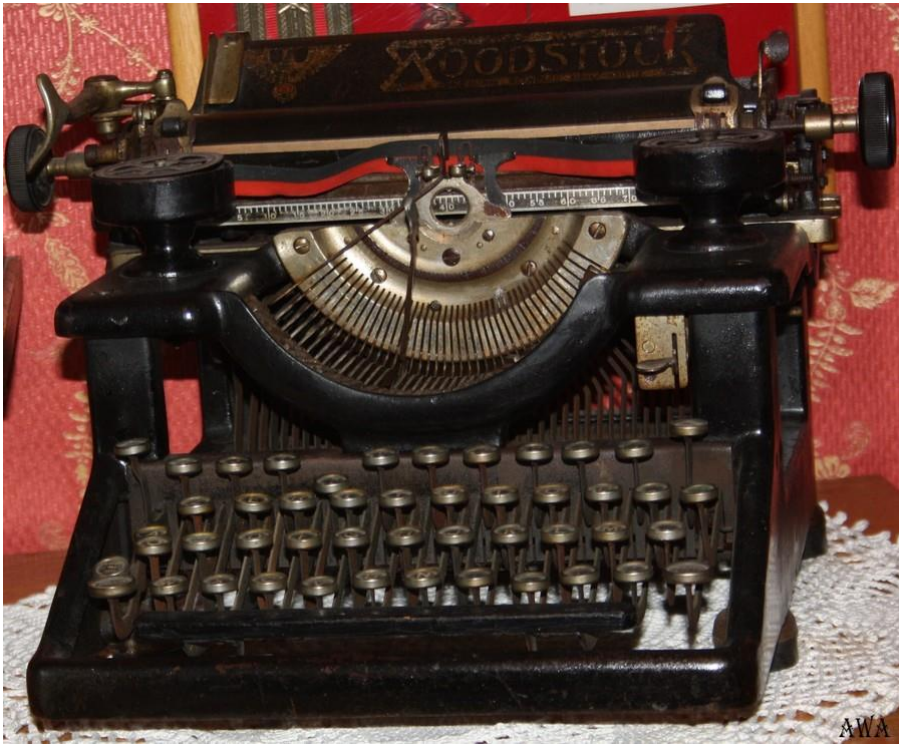
Machine à écrire

Réminescence : quels souvenirs anciens vous évoquent ces images / objets ?