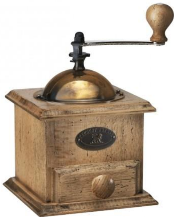
Moulin à café