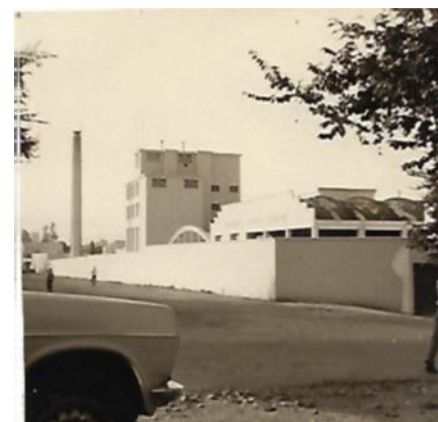
Brasserie du Nord Marocain.

La BRANOMA en constant progrès produit actuellement 77.000 hectolitres de bière contre 60.000 en 1970. Elle produit également 5.400.000 bouteilles de Judor et autres limonades.